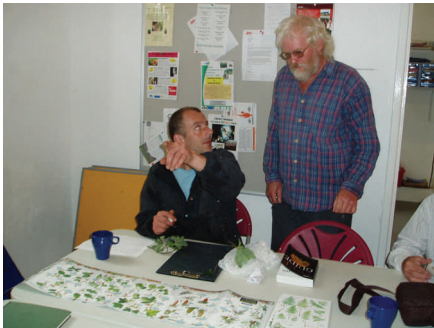
Mae pobl leol yng Nghwmaman yn cydweithio â'r arbenigwyr i gofnodi'r bywyd gwylt a'r planhigion yn yr ardal

SIOPAU GWYDDONIAETH CYMRU SCIENCE • SHOPS • WALES