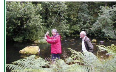
Gwnaeth Siopau Gwyddoniaeth Cymru ymchwil ar ran Cymdeithas Pysgotwyr Merthyr

Pan fydd wedi gorffen, byddwn yn cynhyrchu adroddiad ar y cyd a sicrhau bod grwpiau eraill yn gallu defnyddio'r wybodaeth. Gallwn sicrhau bod y wasg leol â gwybodaeth am y prosiect. Gallwn hefyd eich helpu i gymryd y camau nesaf wrth ddefnyddio canlyniadau'r ymchwil. Wedyn, byddwn yn edrych nôl gyda'n gilydd i asesu llwyddiant y prosiect ac a oes yna wersi gallwn ei ddysgu i'n helpu â'n brosiectau yn y dyfodol.